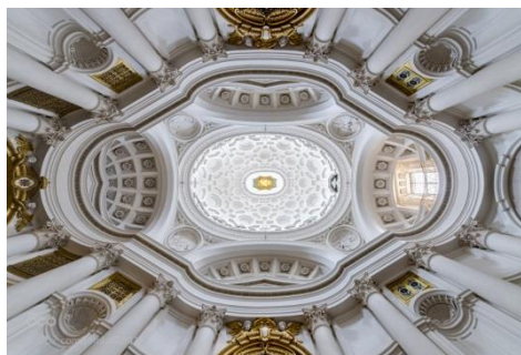
Kuppelloft, San Carlo alle Quattro Fontane