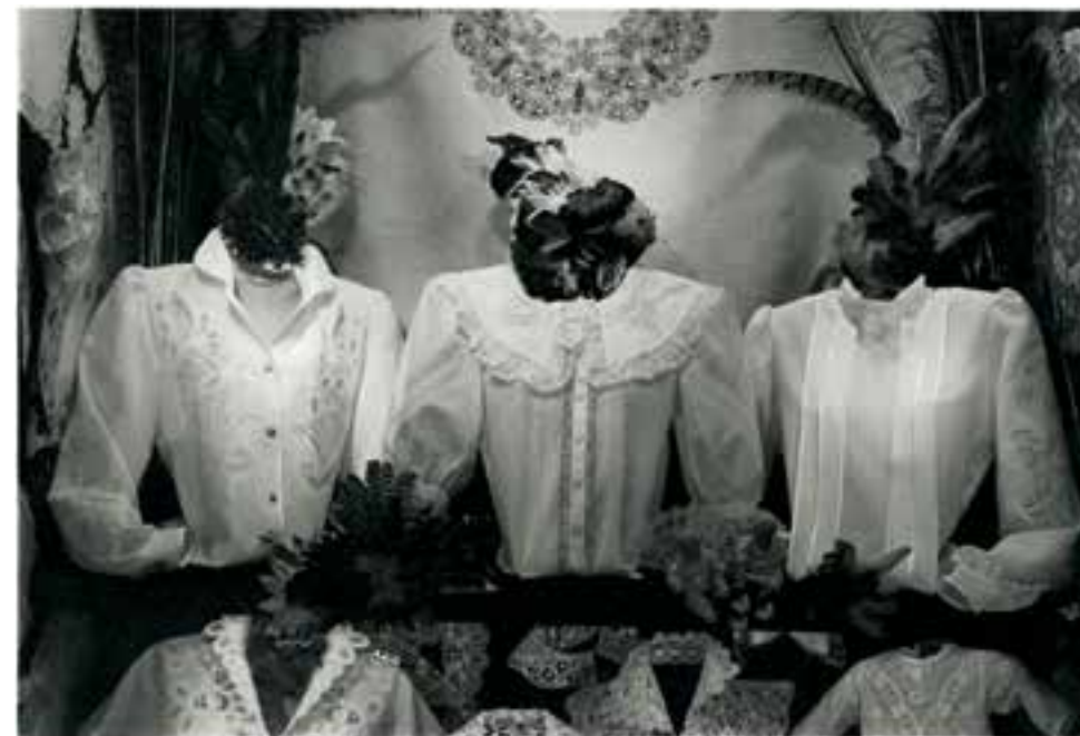
Souvenirs, Bruxelles (1992)