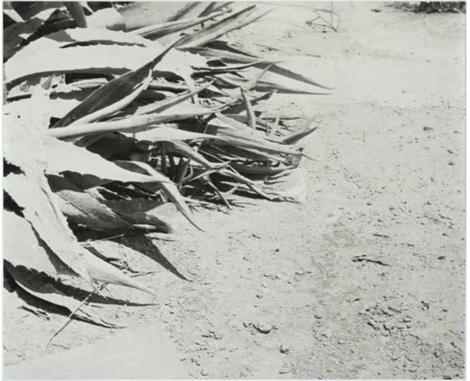
Dust Malia, Kreta (1989)