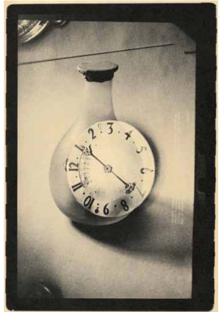
Museum Europa (1991)