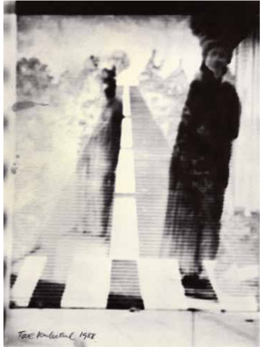
Rum Tid (1988)