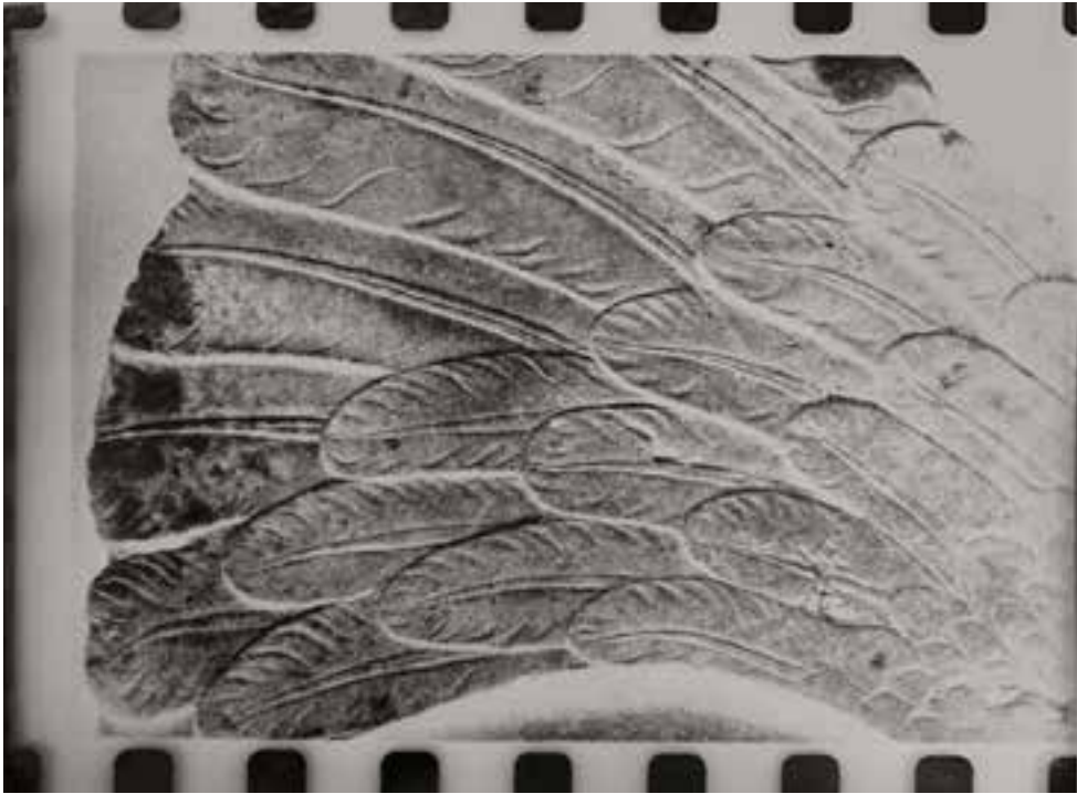
Vinge, Danmark (1986)