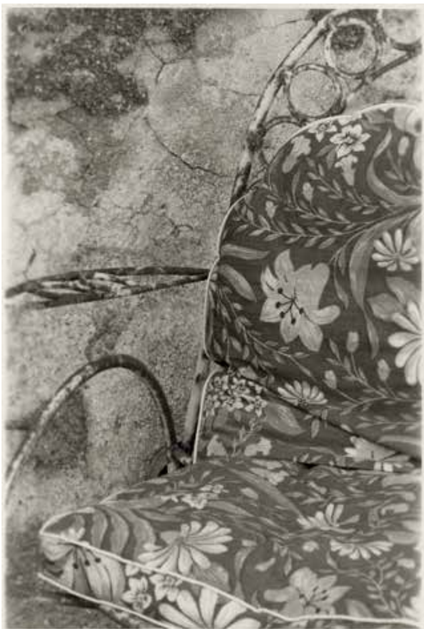
Souvenirs, Kreta (1989)