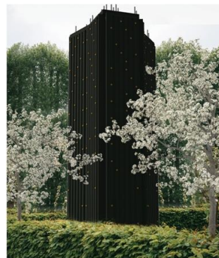
Menageri, illustration , 2016

Ny arkitektur i barokhaven PAVILLON II 2015-2017