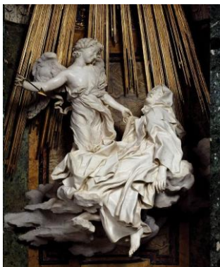
Giovanni Lorenzo Bernini, Den Hellige Teresas ekstase , 1647-1652