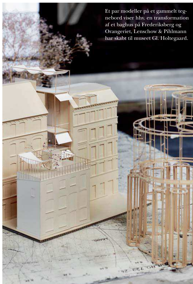
Et par modeller på et gammelt tegnebord viser hhv. en transformation af et baghus på Frederiksberg og Orangeriet, Lenschow & Pihlmann har skabt til museet Gl. Holtegaard.