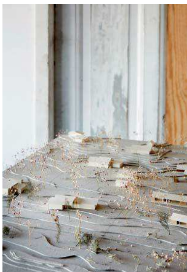
Et skitseprojekt af en række sommerhuse uden for Rågeleje i Nordsjælland er under udarbejdelse.

“VORES TILGANG TIL ARKITEKTUR er stofflig og realistisk forstået på den måde, at vi ofte tager udgangspunkt i det reelle og eksisterende. Det gælder stedets historie, men i høj grad også den konkrete bebyggelse: Hvilke fortællinger kan vi bygge videre på? Vi ønsker, at vores arkitektur skal handle om holdbarhed, brugbarhed og en vedvarende æstetisk oplevelse.”