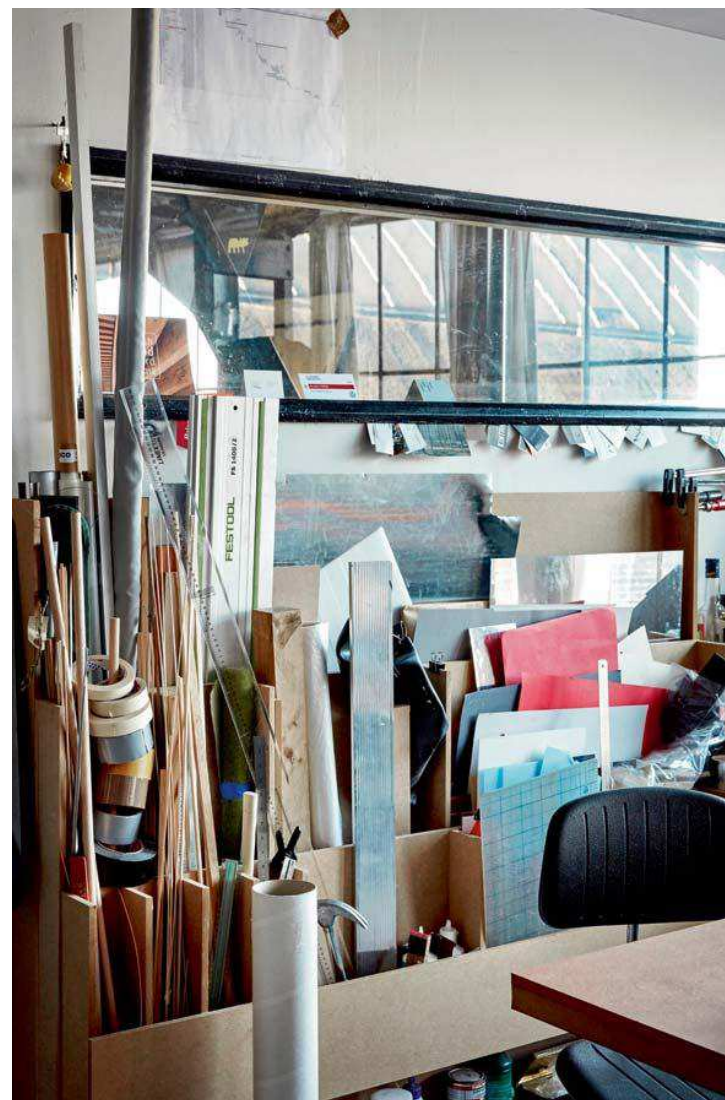
Materialeprøver og andet grej er systematisk arrangeret i Lenschow & Pihlmanns studio på Skabelonloftet. Et aflangt vindue skaber lysgen-nemfald fra det store fællesrum.