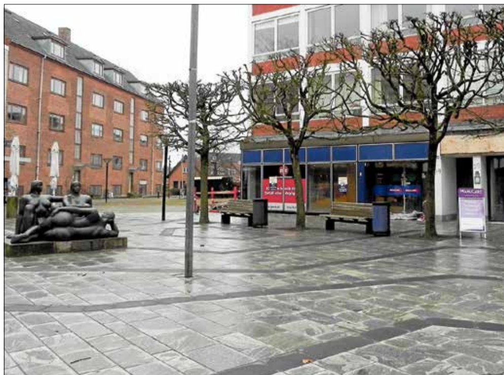
Den tidligere Irma kommer fra juni til at rumme en af Kræftens Bekæmpelses »IGEN« forretninger.