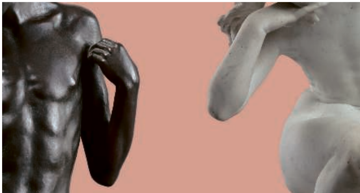
Perfect Poses. PR Foto: Glyptoteket