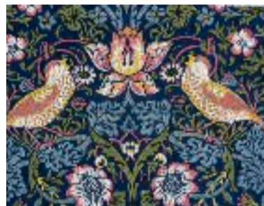
William Morris.

Nivågaard åbner 13. februar dørene til den første store udstilling på dansk grund med den engelske kunstner William Morris, der særligt er kendt for sine mønstrede tekstiler og farverige tapeter og som en af hovedfigurerne i Arts & Crafts-bevægelsen. Men William Morris var også både