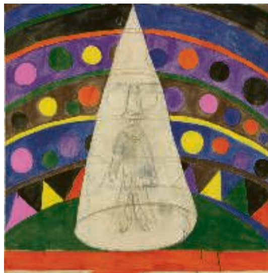
Spotlight, (2009) af Tal R. ©TAL R/COURTESY GALLERI BO BJERGGAARD, FOTO: JOCHEN LITTKEMANN

på en kugle. Det er før forestillingen, og ingen glæder sig.