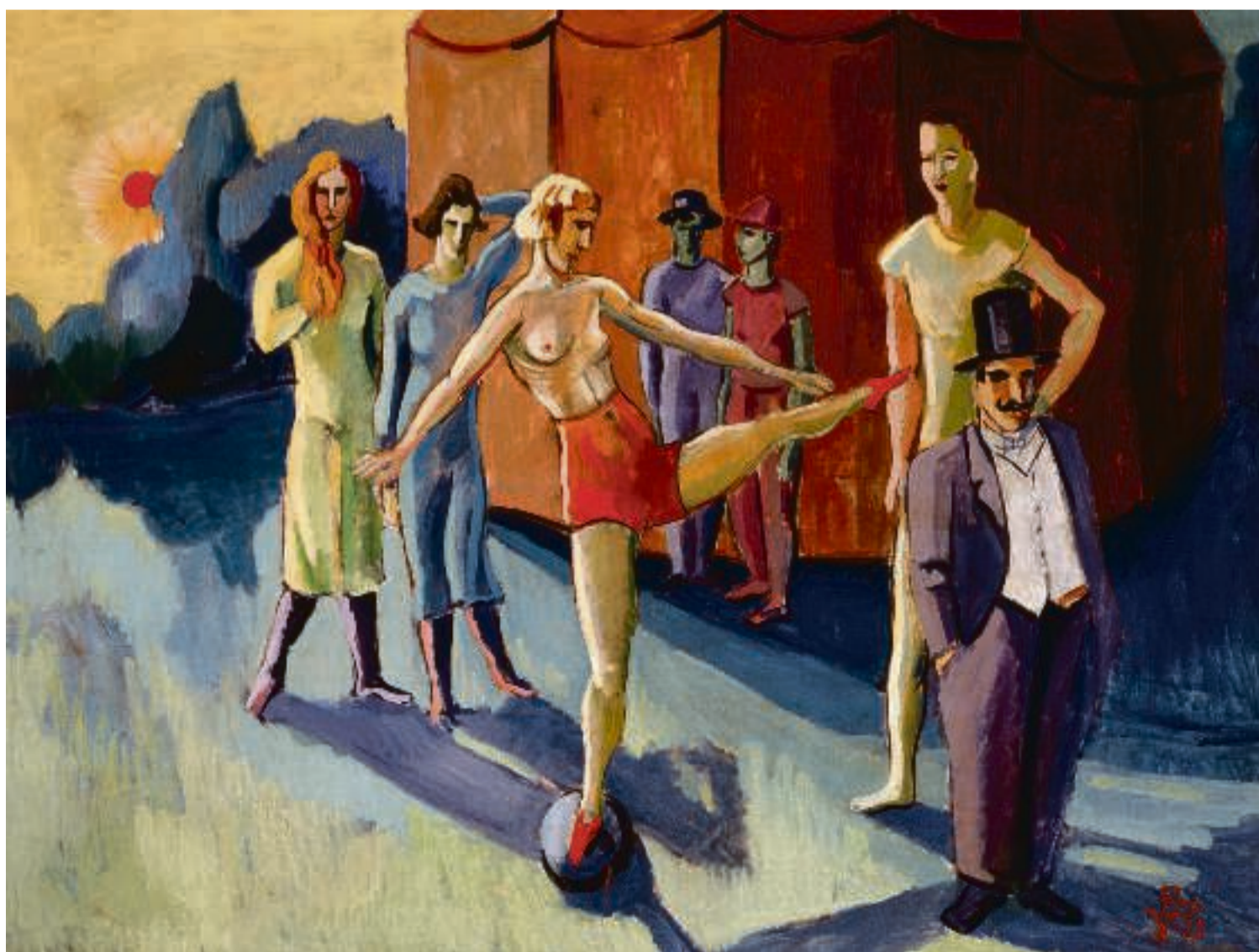
Cirkusfolk uden for et telt, (1928) af Vilhelm Bjørke-Petersen.

Circus. Gl. Holtegaard. Attemosevej 170 Holte. Til 05/01/20