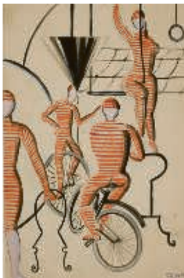
Artister i sribet tøj, (1927) af Franciska Clausen.