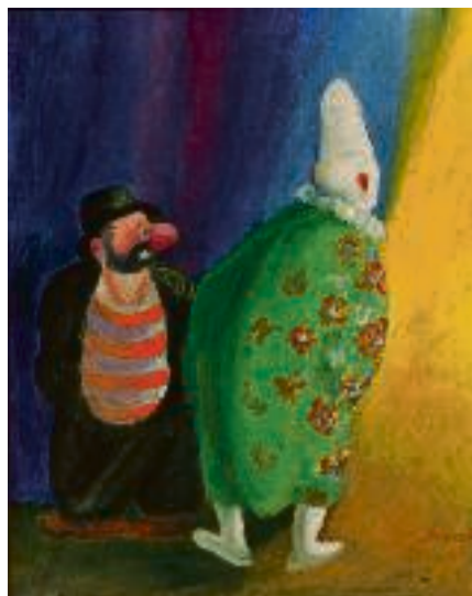
Grøn klovn, (1940) af Robert Storm Petersen.