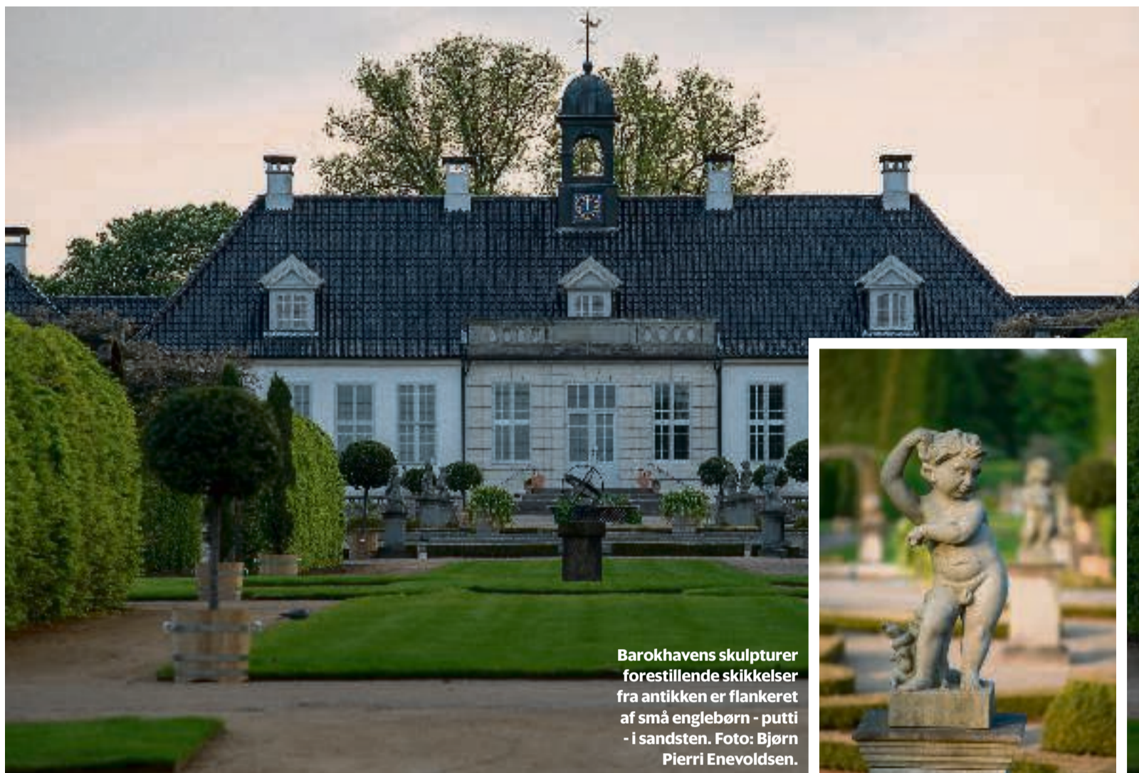
Hovedhuset set fra haven med dens grønne vægge. Foto: Bjørn Pierri Enevoldsen

Barokhavens skulpturer forestillende skikkelser fra antikken er flankeret af små englebørn - putti - i sandsten. Foto: Bjørn Pierri Enevoldsen.