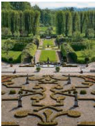
Fra hovedbygningen breder Laurids de Thurahs barokhave sig ud.

Flere Søndagsudflugter på www.berlingske.dk