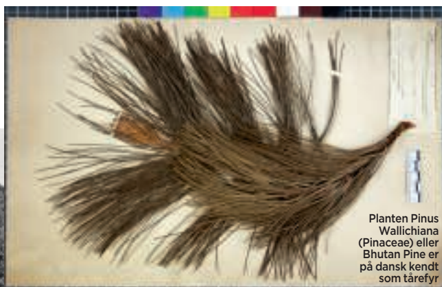
Planten Pinus Wallichiana (Pinaceae) eller Bhutan Pine er på dansk kendt som tårefyr