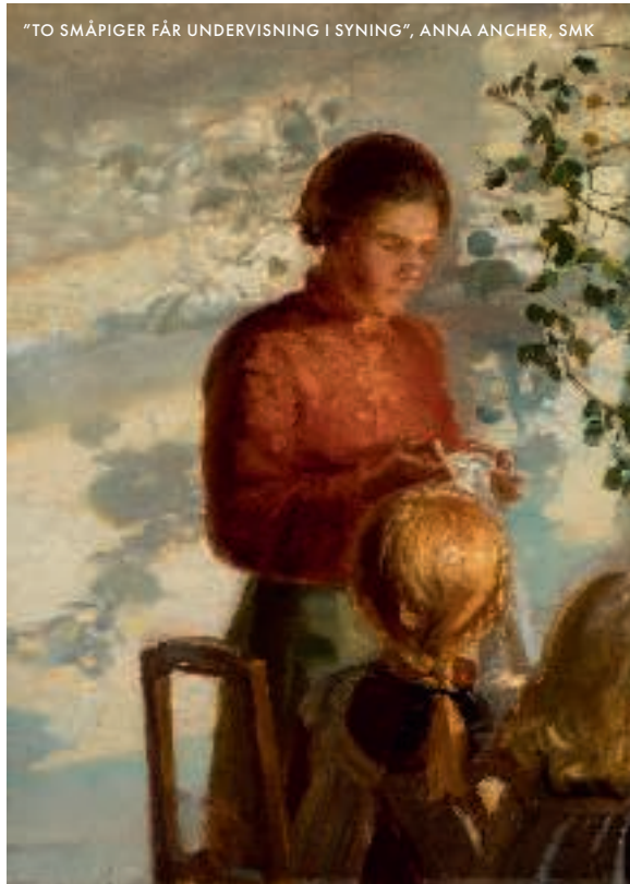
"TO SMÅPIGER FÅR UNDERVISNING I SYNING", ANNA ANCHER, SMK