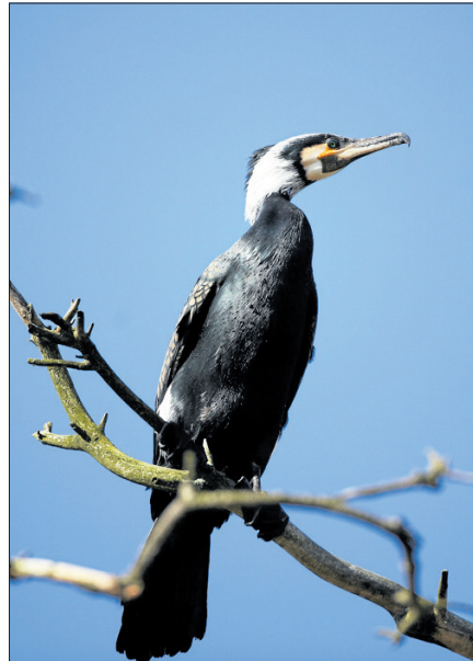
Skarven ses ofte siddende med vingerne spredt ud på sten eller pæle i fjorden.

Kig også efter stor skallesluger, som er på vinter-visit. Skarven, som ofte ses siddende med vingerne spredt ud på sten eller pæle i fjorden. Sådan sidder den for at tørre vingerne, der bliver våde, når den dykker. Kig også efter både sangsvaner og knopsvaner,