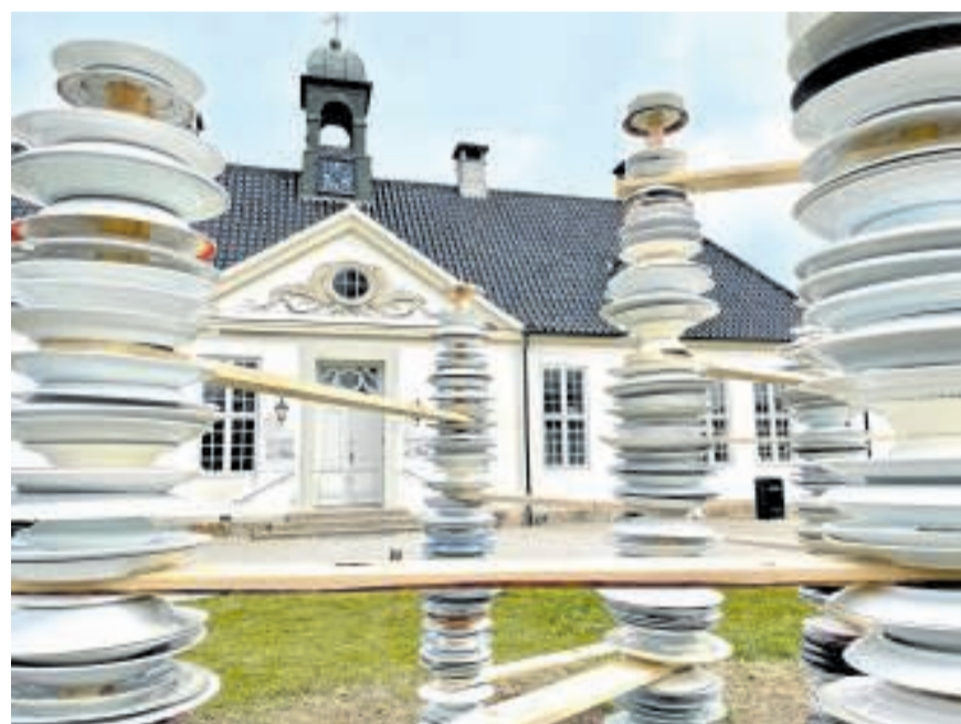
▲ Detalje fra værket "Give and Take".