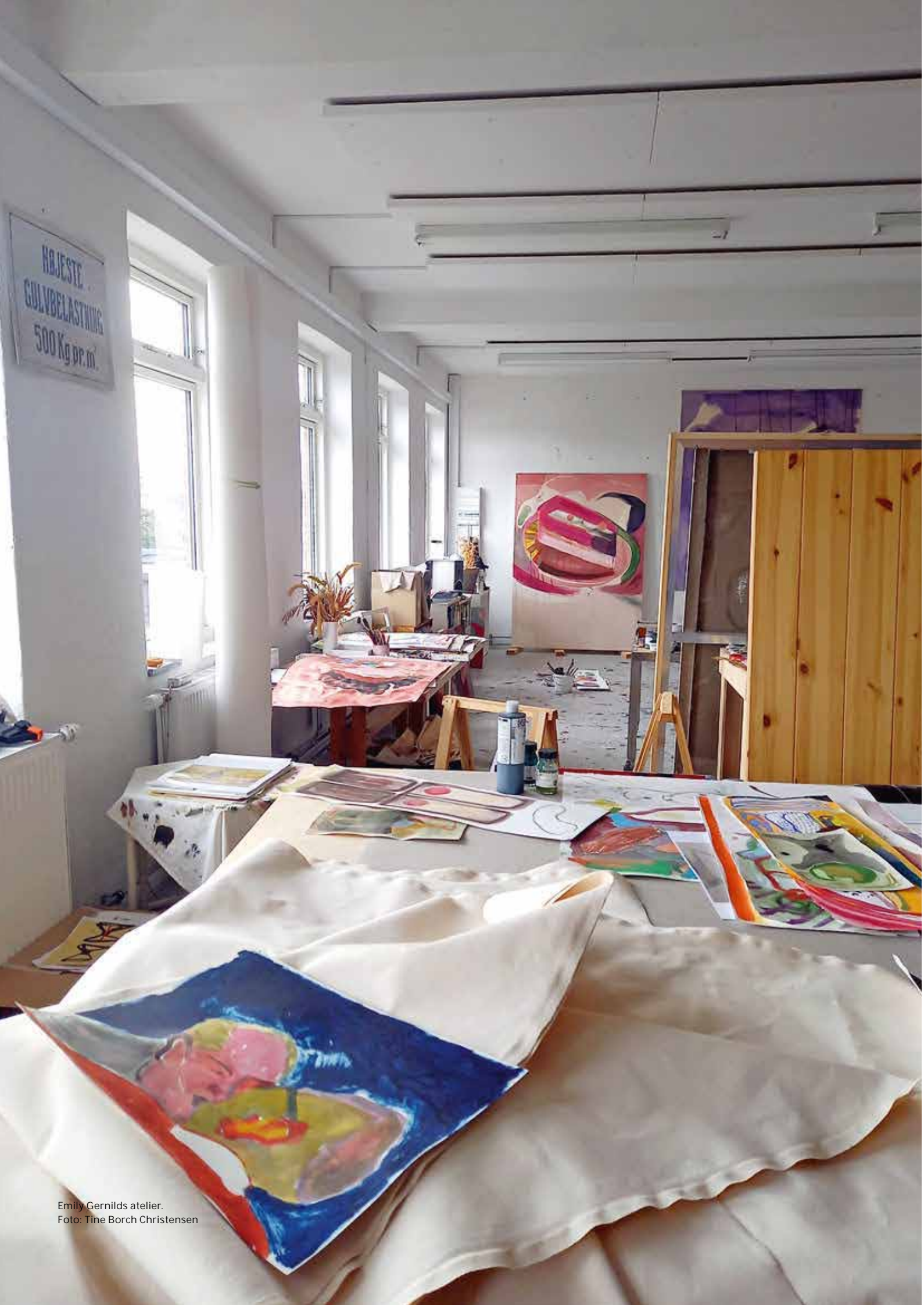
Emily Gernilds atelier.