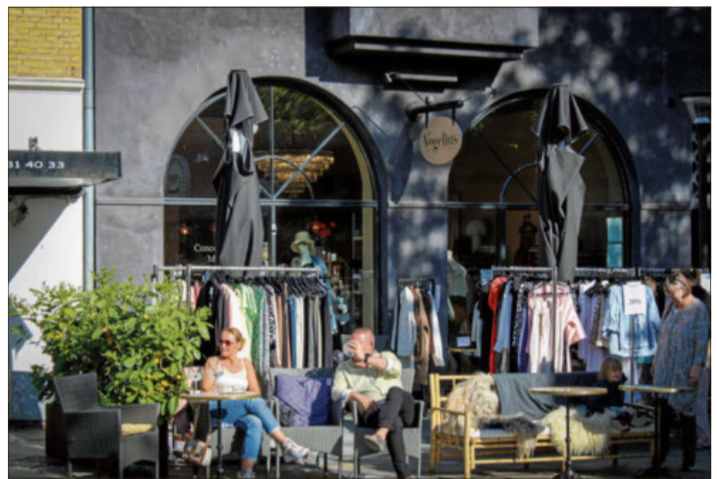
Borgerne i Rudersdal har forventninger om et inspirerende byliv.

Herudover vil der også blive lagt vægt på om: Initiativet er nyskabende og eksperimenterende, om initiativet forventes at have gjort