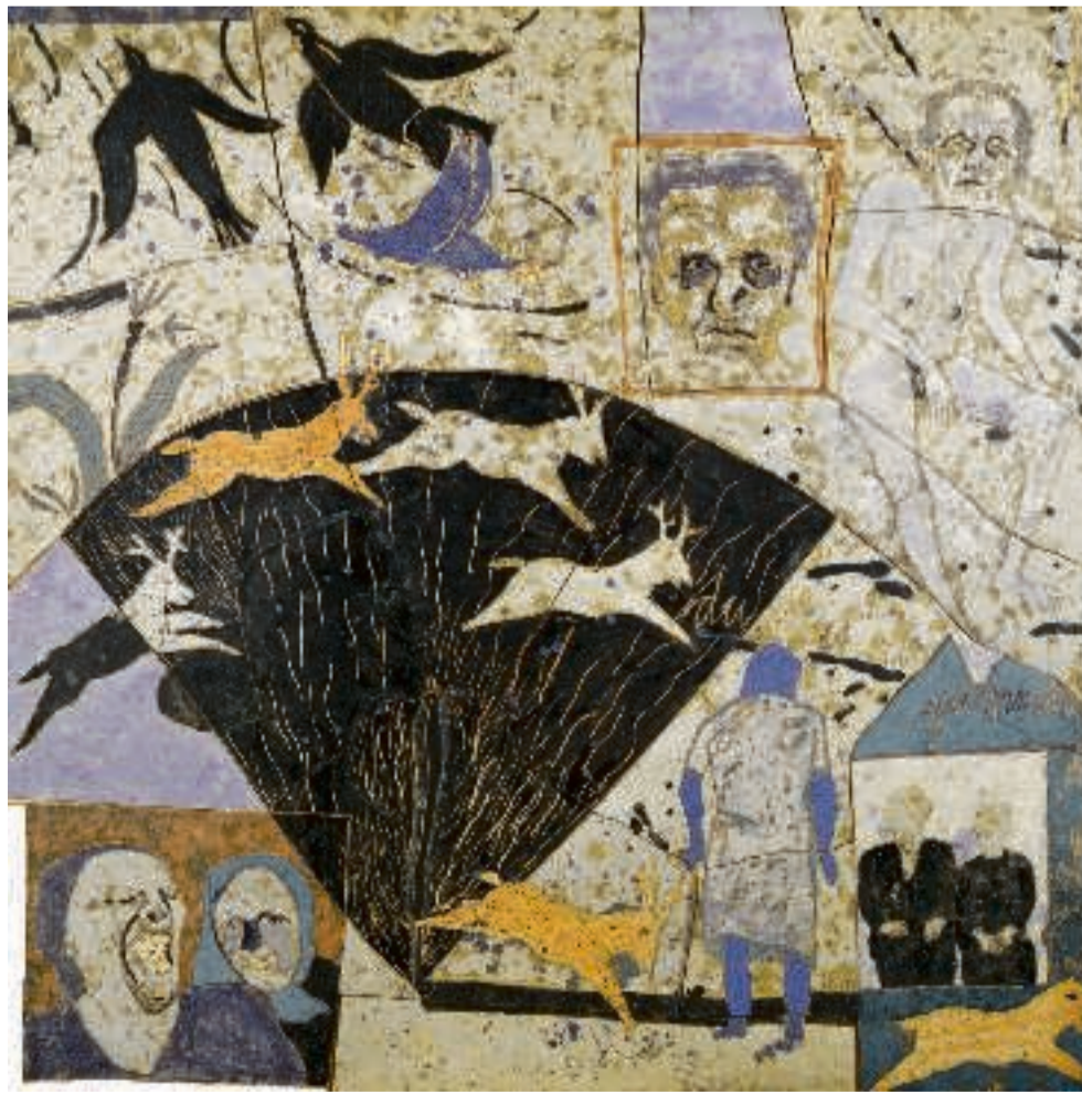
Du bliver selv gammel, 1978.